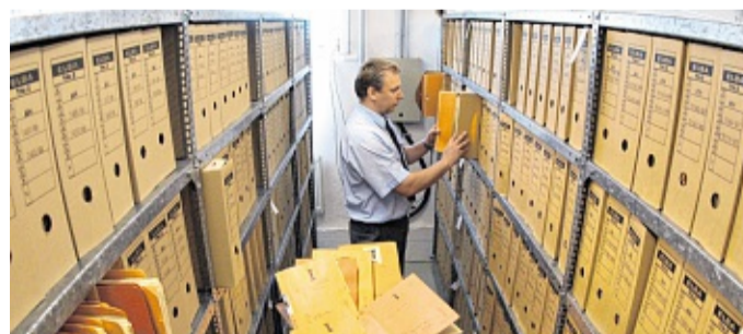
Ein kleiner Ausschnitt aus der Gesamtstrecke von 111 000 Metern Aktenmaterial.

Ergänzend zur Bürgerberatung ist die Ausstellung „Die Stasi“ zu sehen, die